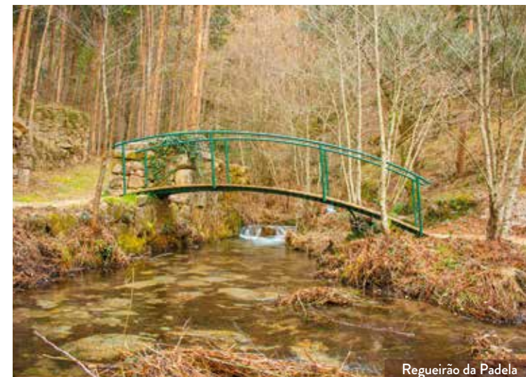
Regueirão da Padela