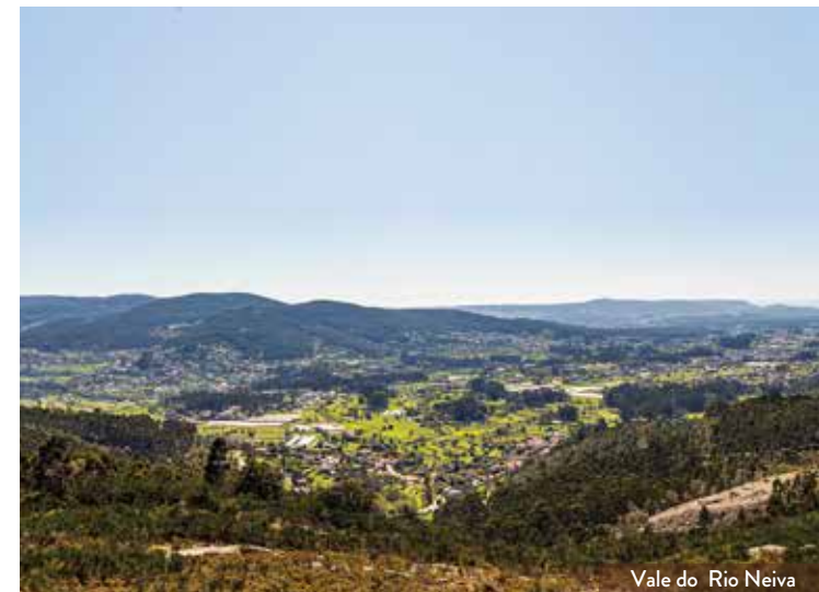
Vale do Rio Neiva