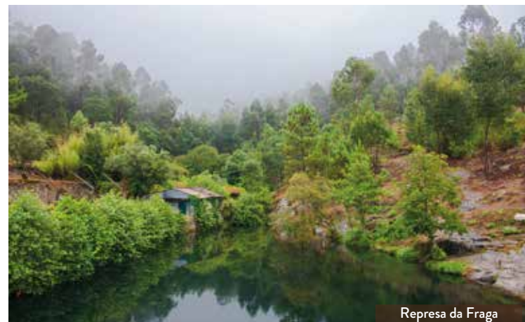
Represa da Fraga

Pelo Ecocircuito contemplam-se imponentes paisagens sobre o Vale do Rio Neiva e compreende-se a relação entre esse rio e a mitologia dos povos galaicos que habitavam esta região e que viviam em castros - como o Castro do Alto dos Mouros. O ribeiro chamado Regueirão da Padela dá o mote para conhecer moinhos e espécies de vegetação ripícola, acompanhando uma boa parte desta experiência, entre fragas, cascatas e charcas. A floresta, nomeadamente a floresta autóctone, é uma presença constante, e o Ecocircuito aflora as práticas comunitárias da sua gestão e a sua origem ancestral. O percurso apresenta algum desnível e, como tal, tem uma dificuldade média. Contando com algumas paragens para usufruir da envolvente, poderá ser percorrido em cerca de 1h30m. Em parte, coincidirá com o "PR23 - Trilho dos Sobreiros", que faz parte da Rede Municipal de Percursos Pedestres de Viana do Castelo e que, com 13,5km, percorre uma parte significativa do Baldio de Carvoeiro.