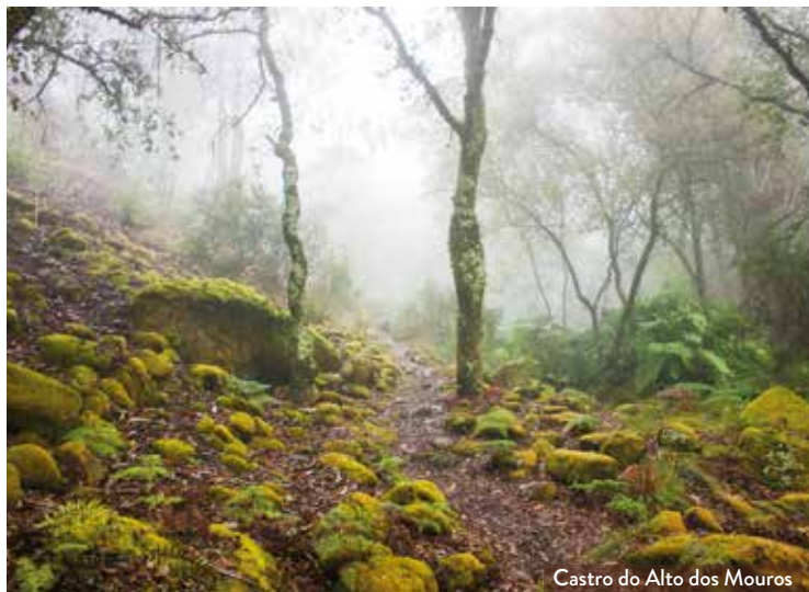
Castro do Alto dos Mouros